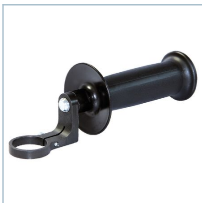
Empuñadura adicional para atornillador con empuñadura central ESM