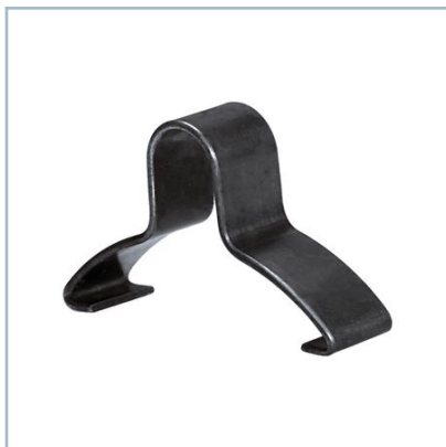
Suspensión para atornillador de empuñadura central ESM