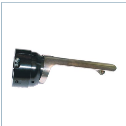
Prolongación de carrera