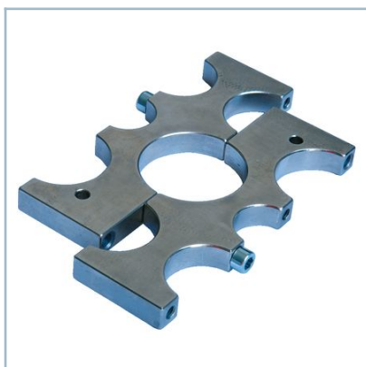
Ayuda de montaje para cabezales acodados