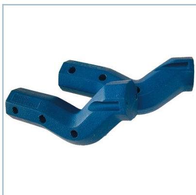
Soporte de atornillador acodado ESA y NXA