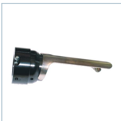
Prolongación de carrera