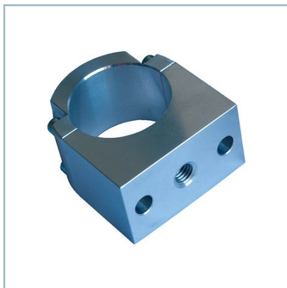
Adaptador para equipos de manipulación