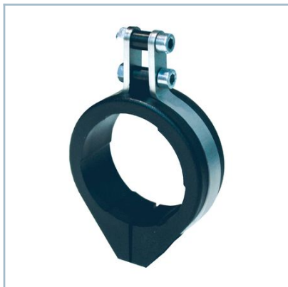
Suspensión giratoria NXA