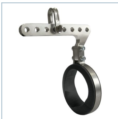
Suspensión giratoria NXA