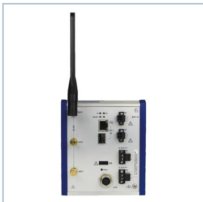
Punto de acceso