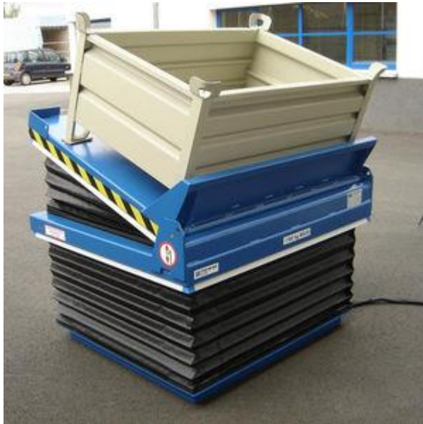
Mesa elevadora con base inclinadora